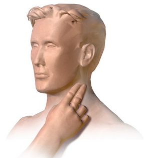
On the Neck